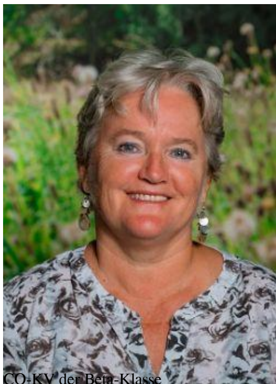
CO-KV der Beta-Klasse