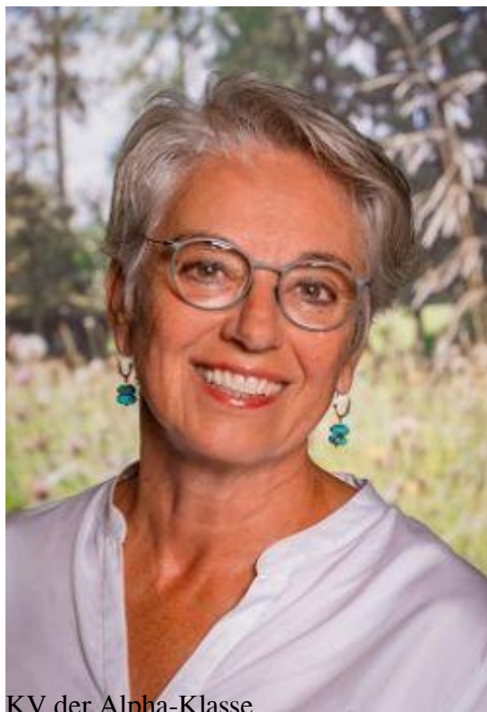
KV der Alpha-Klasse