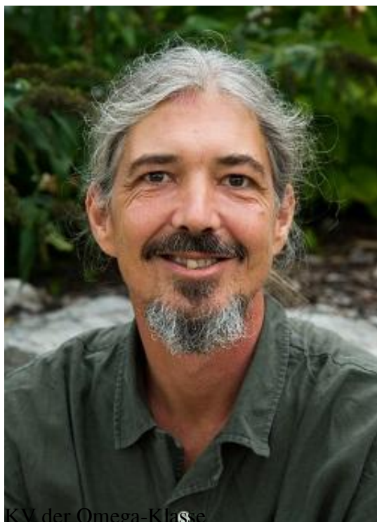
KV der Omega-Klasse Sonderpädagoge, Leiterstellvertreter