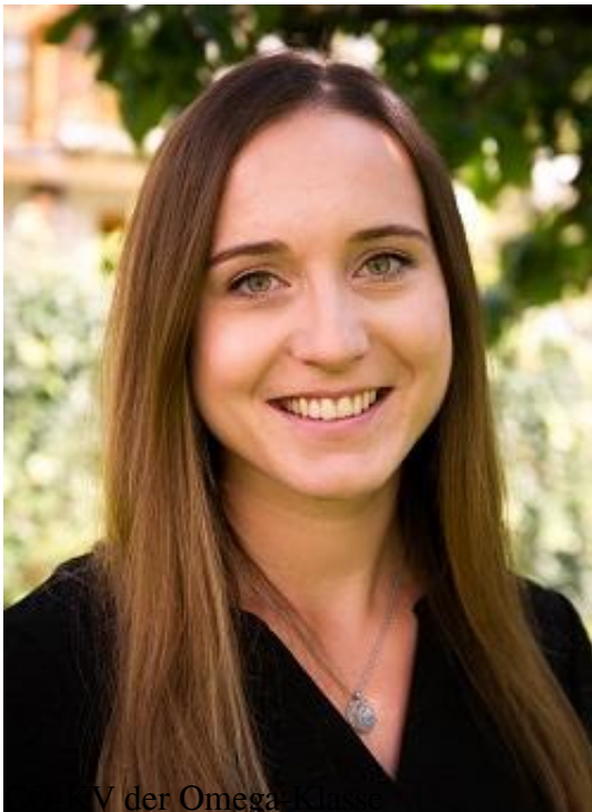
V der Omega Klasse Spanisch, Biologie