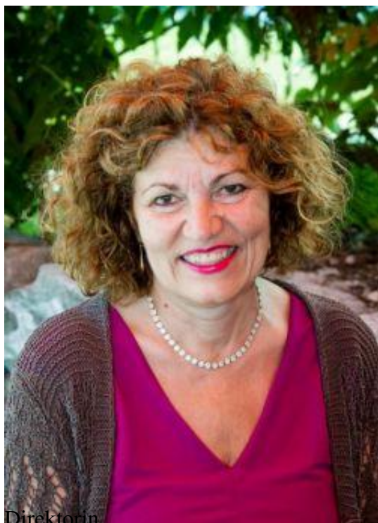
Direktorin Mathematik, Werkerziehung für Knaben, Informatik