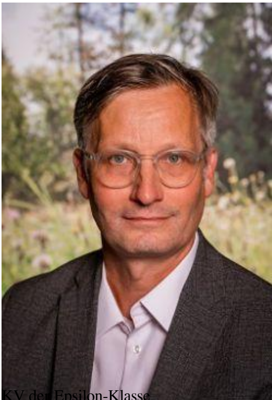
KV der Epsilon-Klasse Deutsch, Physik/Chemie