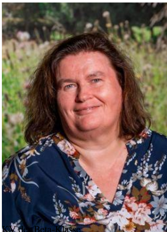
KV der Beta-Klasse