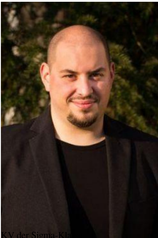
KV der Sigma-Klasse Englisch, Geografie