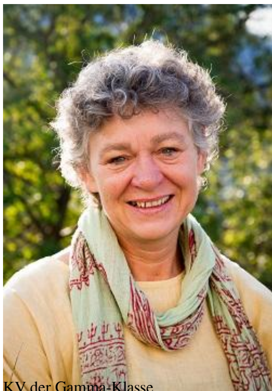
KV der Gamma-Klasse Deutsch, Musik