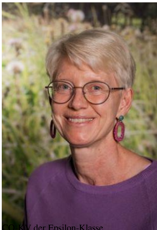
CO-KV der Epsilon-Klasse